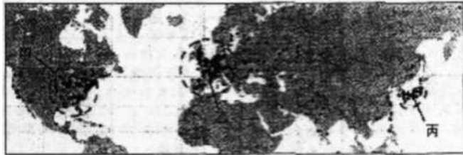
图，北半球核电站分布

核能是 20 世纪初人类的一项伟大发现，其成果被逐步应用到生产和生活领域。目前，随着各国的核能计划增多和一些核事故的发生，公众日益关注核安全问题，“安全与创新利用核能”是人类共同面对的重大课题。