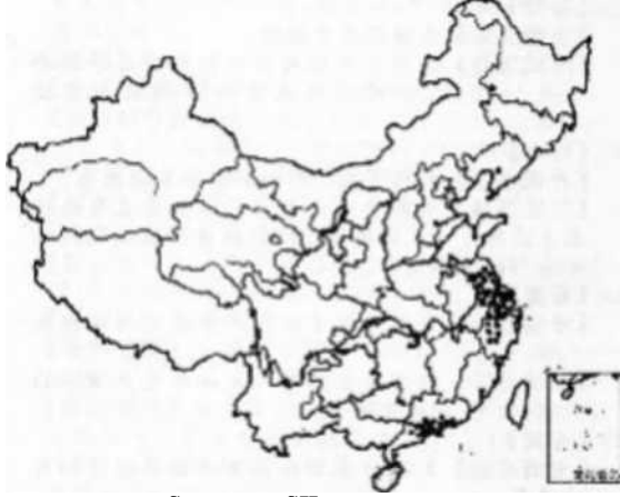
图 8 我国从事外 S 纺织品和 SII 生产的专 4 镇分布

(3) 近年来，许多纺织和服装制造企业逐渐由东部沿海地区向中西部转移。试分析产业转移的原因。